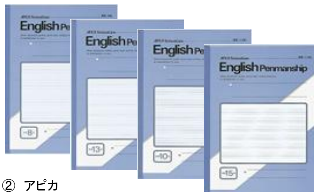
② アピカ スクールライン英習 8・10・13・15段