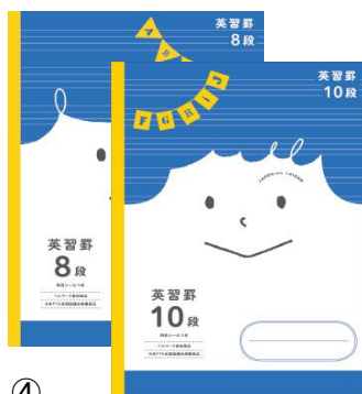
④ ショウワ・ジャポニカフレンド 英習8段・10段