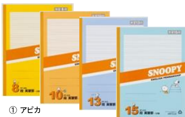
① アピカ スヌーピー英習 8・10・13・15段

どの時期にどのような需要があるのかまだ手探りですが、チーム学納が準備している学習帳をご案内します。