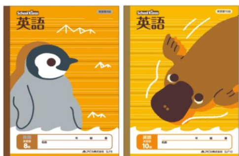
③ アピカ・スクールキッズ 英習8段・10段